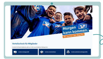
Online Mitgliedervorteile checken

Weitere Beispiele: Die größte Bausparkasse in Deutschland, die Schwäbisch Hall, fördert Bankmitglieder bei der Finanzierung energetischer Modernisierungsmaßnahmen durch Zinsvorteile. Und auch beim Ratenkreditexperten der Gruppe können Mitglieder Zinsvorteile bei maximalem Leistungsumfang eines easy-Credits erhalten. Diese und viele andere Vorteile finden sich auf der Internetseite vieler Volksbanken und Raiffeisenbanken unter der Rubrik Mitgliedschaft. Einige Banken bieten ihren Mitgliedern hier auch einen digitalen MitgliedervorteilsCheck an. Dieser zeigt anhand von Beispielrechnungen eine konkrete Ersparnis der Mitgliederprodukte auf und bietet die Möglichkeit, diese online abzuschließen oder den Kontakt zum Bankberater herzustellen.